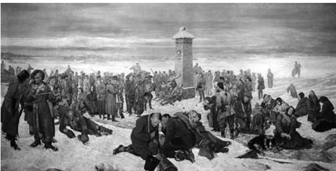
Прощание полков с Европой (с картин А. Сохачевского)

24 июля (5 августа) казнены члены самопровозглашённого правительства – Трауггутт, Краевский, Точиский, Езёранский. Ре-