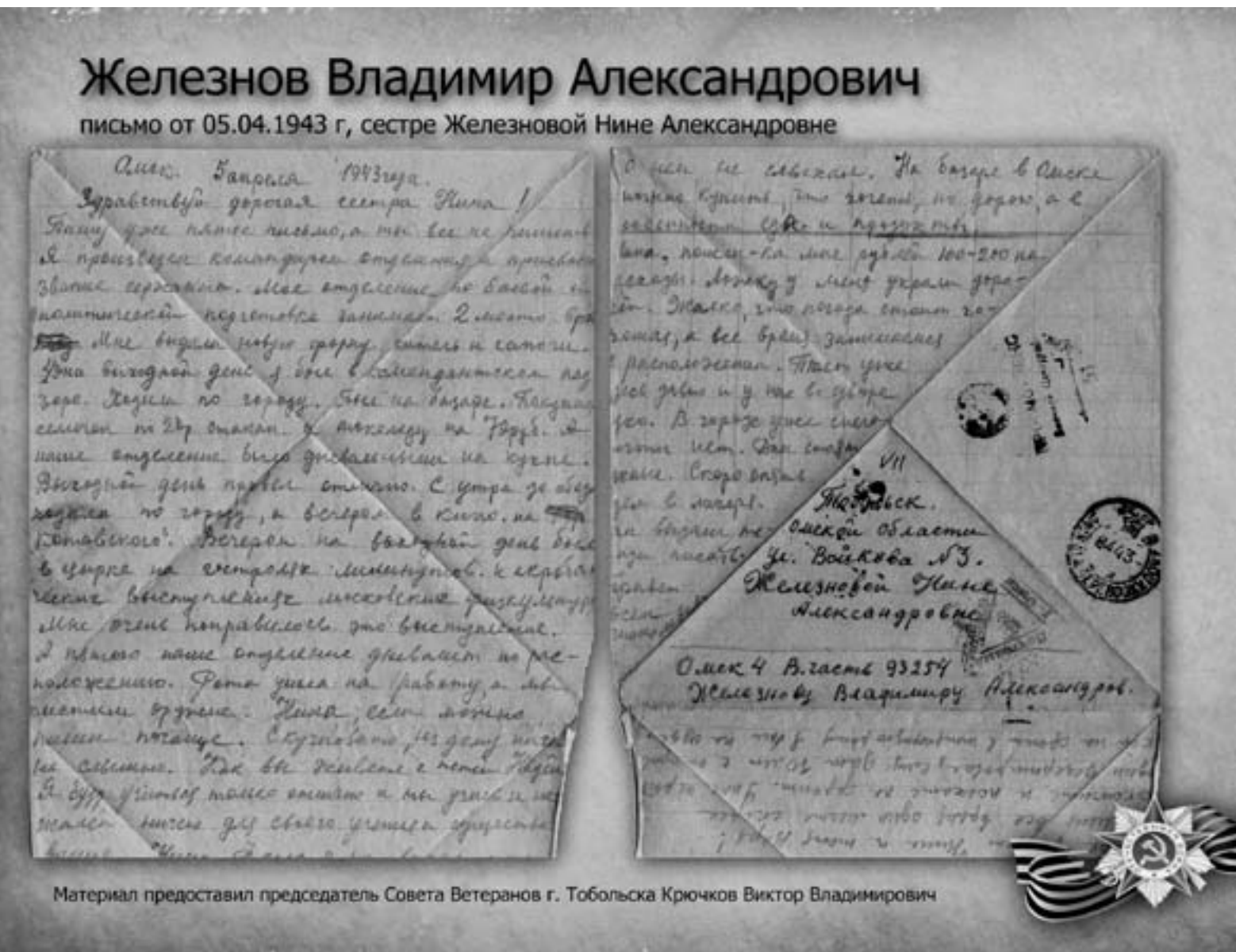
Материал предоставил председатель Совета Ветеранов г. Тобольска Крючков Виктор Владимирович

Совместный проект общественного благотворительного фонда «Возрождение Тобольска», городского совета ветеранов, ТК «Ермак» и редакции газеты «Тобольская правда»