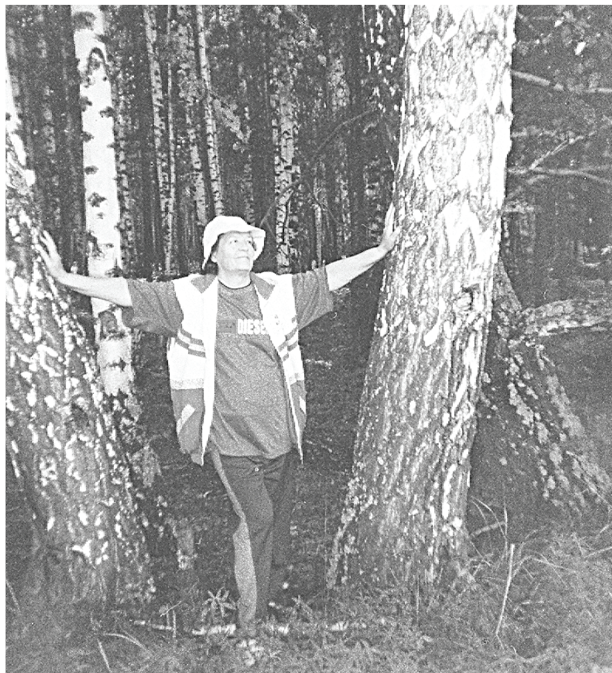
А вдохновение и энергию жизни нужно черпать в природе.