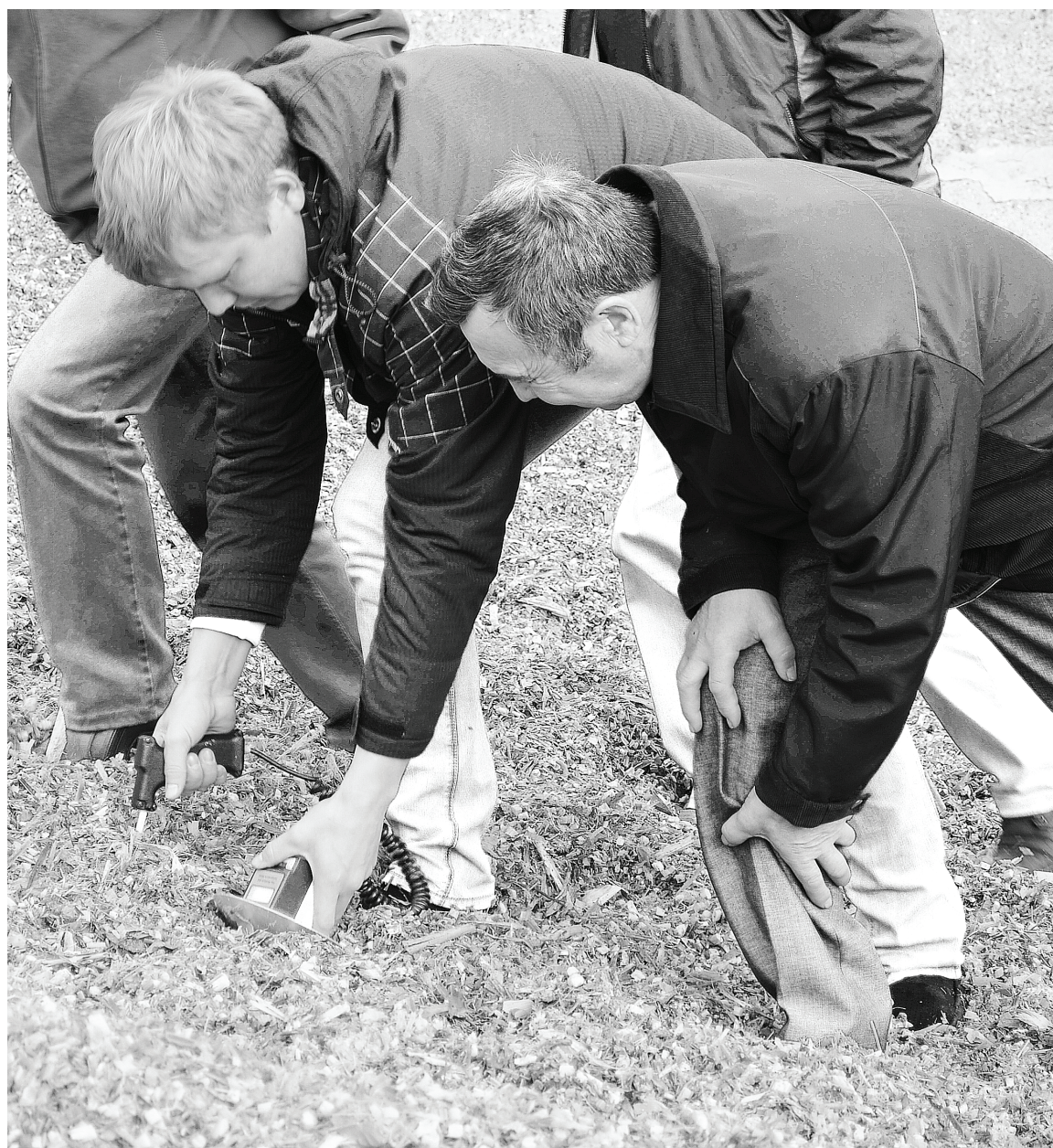
Проверка состояния заложенного силоса. В современном сельском хозяйстве без точных приборов не обойтись.