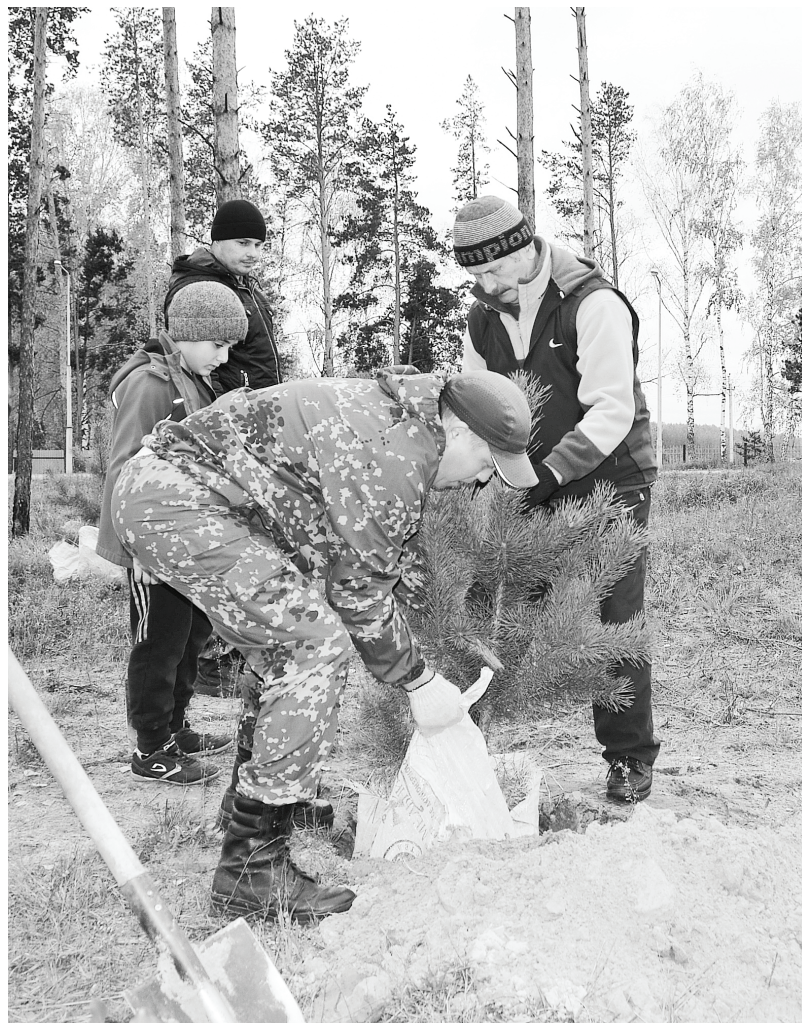
В спортивном комплексе «Нижняя Тавда» появилась новая аллея хвойных деревьев, в посадке которых приняли участие представители старшего поколения, работники АУ «Спорт и молодёжь», учащиеся Нижнетавдинской средней школы.