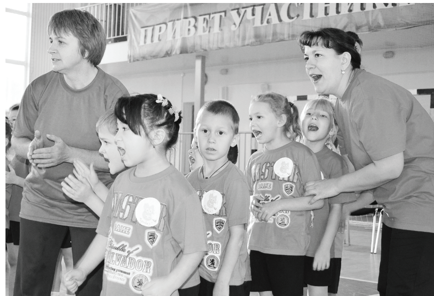
На этапе команда из детского сада «Берёзка».