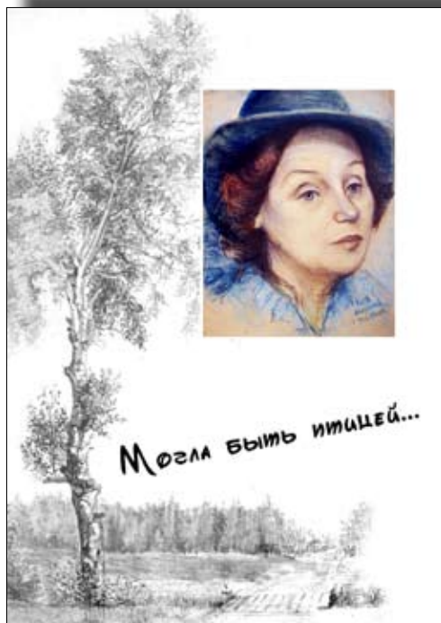
Страница из оформления книги