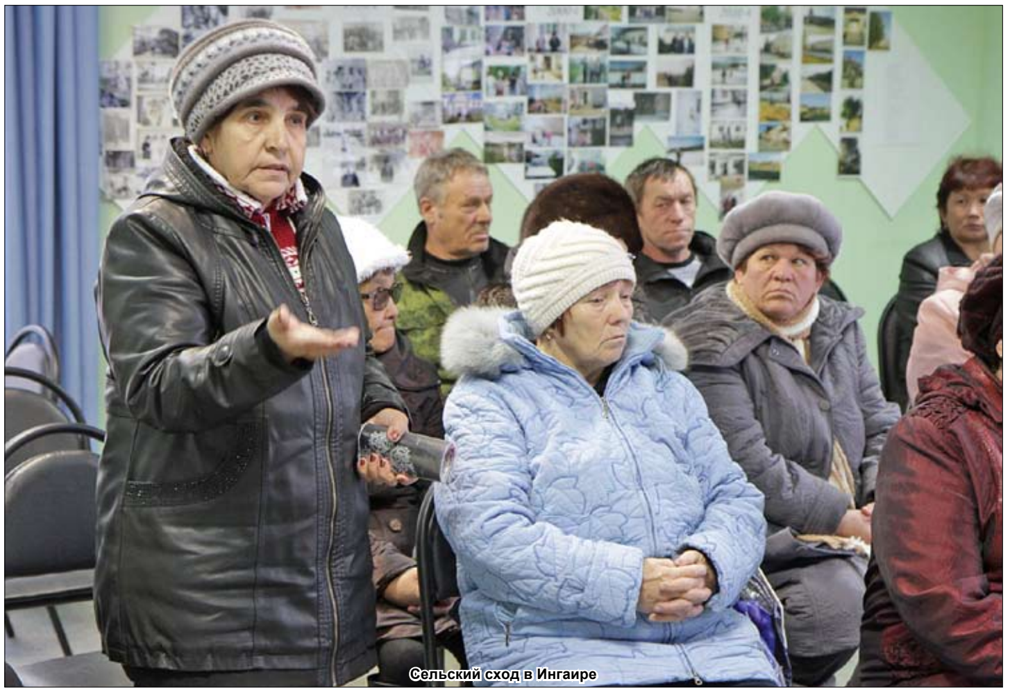
Сельский сход в Ингаире

Суббота, 26 октября 2013 г. № 86 (7600) Цена 5 руб. 27 коп. Основана в 1962 г. http://www.tyumedia.ru/20/ , http://ssib.ucoz.ru