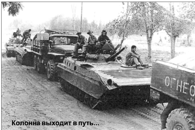
Колонна выходит в путь...

- Перед каждым боем было страшно, и только мамыны письма грели душу, - вспоми-