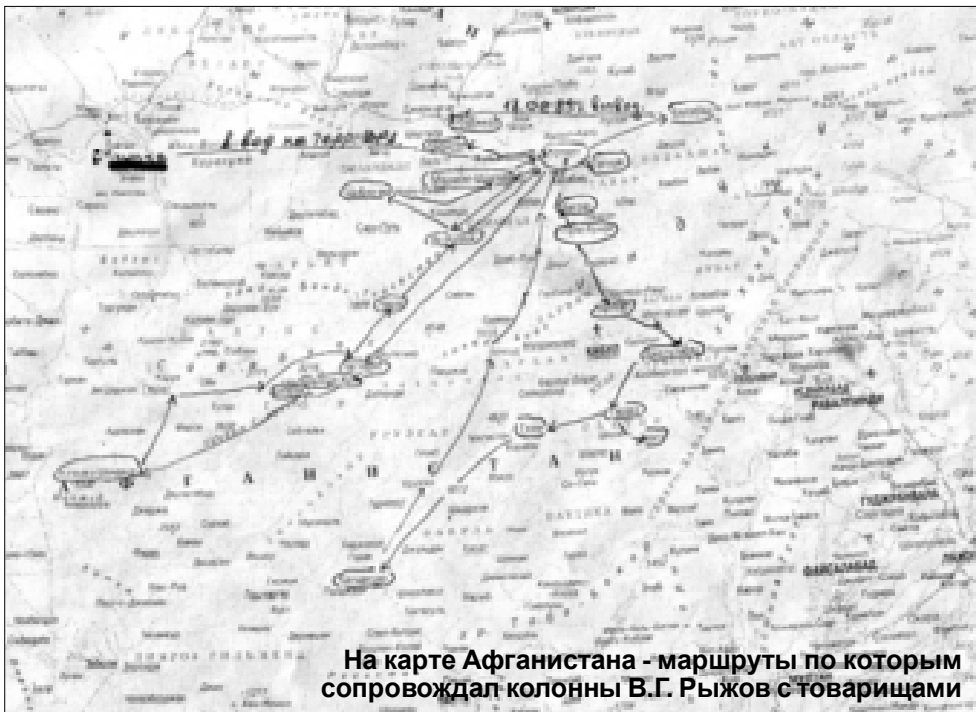
На карте Афганистана - маршруты по которым сопровождал колонны В.Г. Рыжов с товарищами