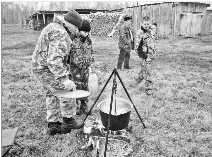
Экстрим экстримом, а обед по расписанию

Обедали экстремалы на охотничьей заимке. В котле буйствовал наваристый бульон. В рублёной избе топились русская печь. Воскресный день близился к концу. И этот день прожит был с пользой для себя, природы и родного Отечества.