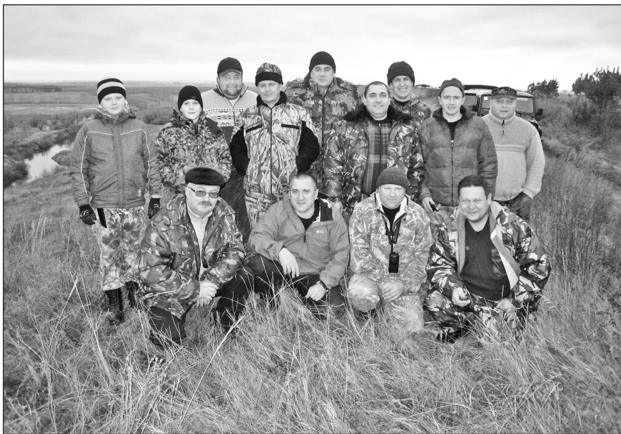
Первый привал на горе Боровлянской