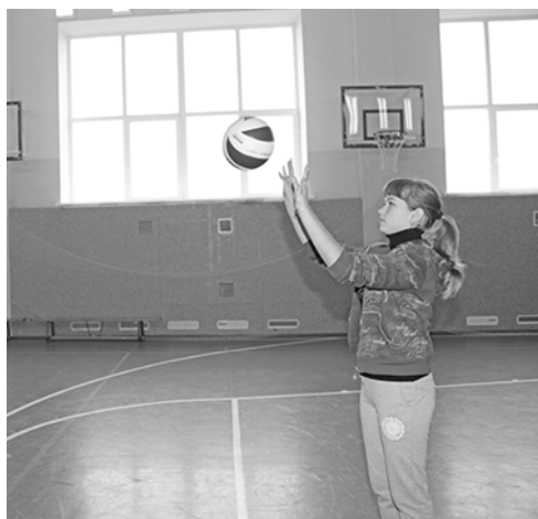
* «Пробуем мяч в игре»