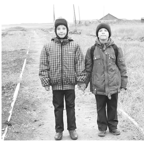
* На тротуаре

В последнее время улицы сёл и деревень района украшают новые дома. Молодые семьи, специалисты в рамках государственных программ получают сертификаты на строительство и приобретение жилья. Возводятся жильё для ветеранов войны, вдов. Хозяева