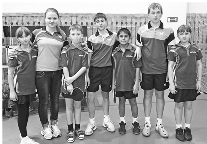
* Теннисисты в новой форме