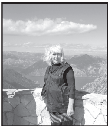
В России – семь верст до небес, А здесь – только протяни руки