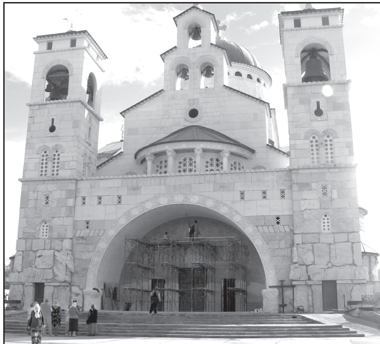
Собор Святого Воскресения в Подгорице. В освящении храма 7 октября 2013 участвовал Святейший Патриарх Московский и Всея Руси Кирилл

На побережье Котора огромные океанские лайнеры. Много туристов из страны восходящего солнца. Группы постоянно пересекаются, с взаимным интересом разглядывают друг друга.