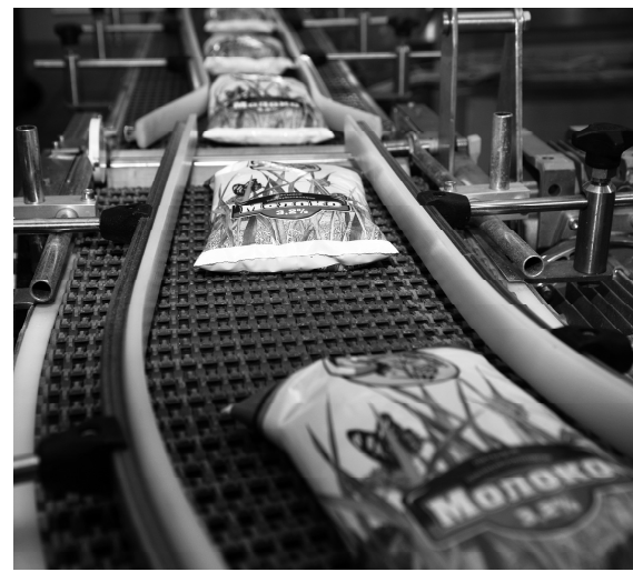
Современное оборудование облегчает труд