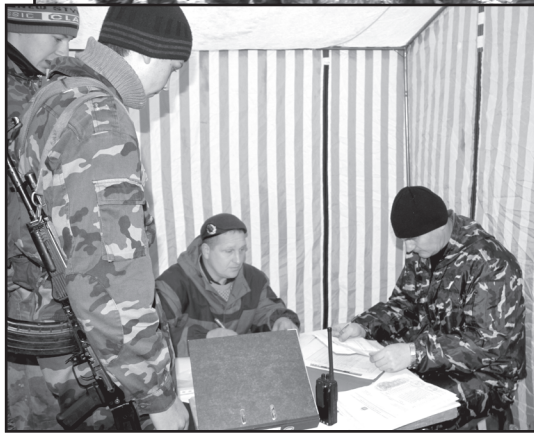
Перед началом испытаний

А трасса идёт по лесу. Кто-то задевает растяжку, и раздаётся взрыв. Обязательный атрибут подобных испытаний — транспортировка раненого. Ребята без проблем справляются с заданием. Снова засада. Кто-то упал. Медработник проверил состояние курсанта и сопроводил к лагерю. Представители областной больницы №22 постоянно присутству-