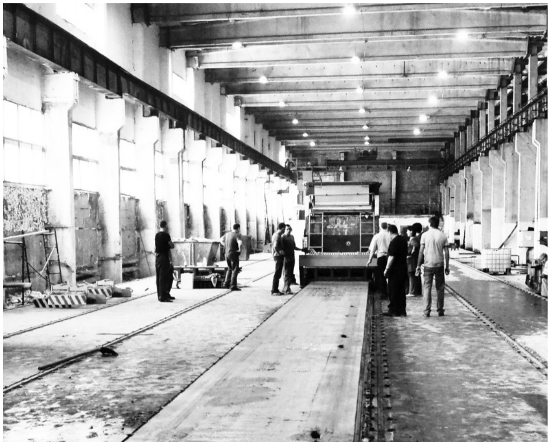
• Инновации – в производство.

В октябре Заводоуковский КСМ запустил технологическую линию непрерывного виброформования преднапряжённых железобетонных изделий.