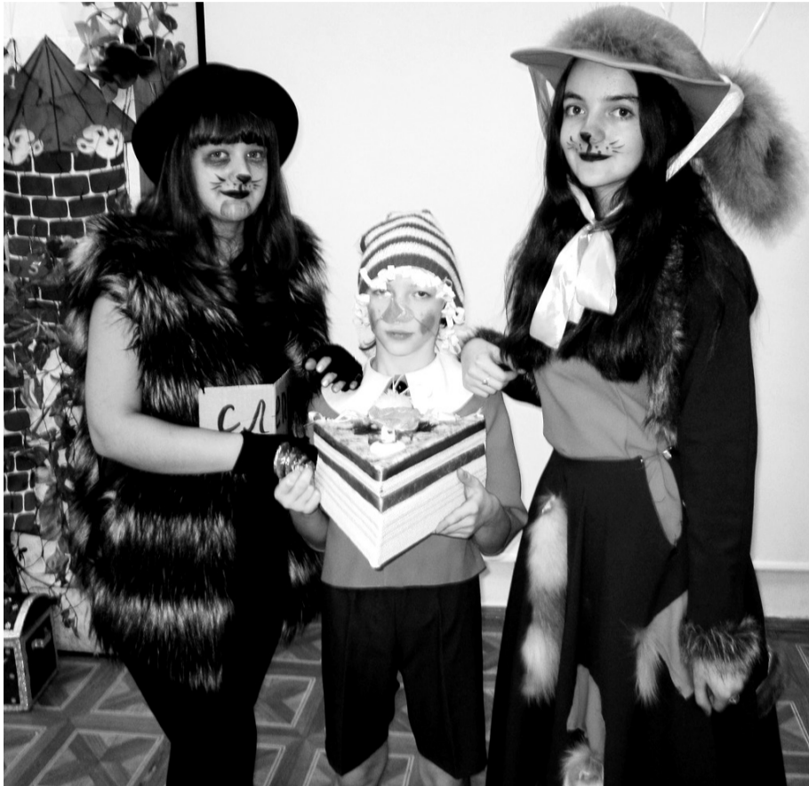
• В руках Буратино кусочек торта из папье-маше – подарок каждой команде-участнице.

В дни осенних каникул юные любители книг побывали на областных детских провинциальных чтениях «Души и творчества полёт».