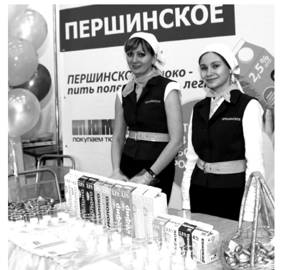
• Дегустация нашей молочной продукции.