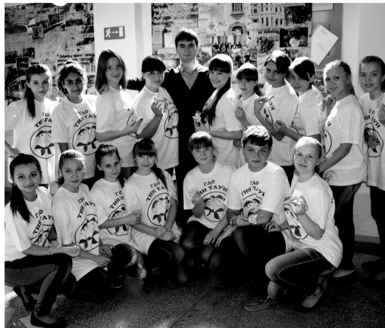
• «Тин тауну» – 15 лет.