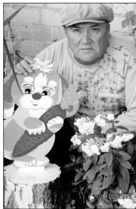
Зайка ушки опустил и морковку обхватил. На пенечке приютился и морковкой угостился.