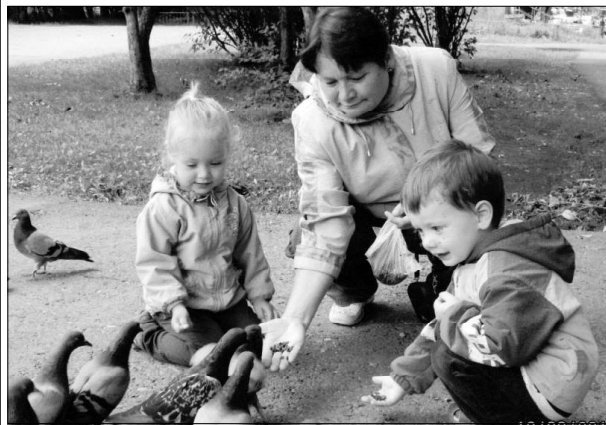
На прогулку мы ходили, голубей зерном кормили. Мои родные малыши с природой дружат от души!