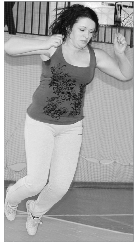
Кто прыгнет выше и дальше?