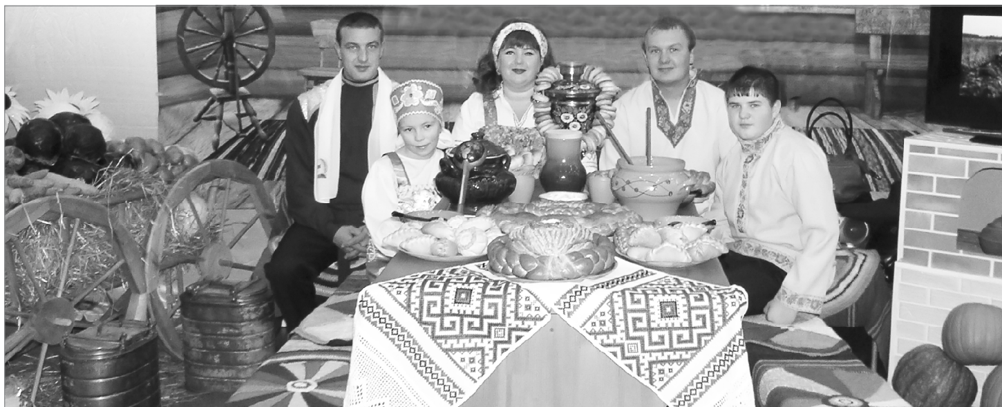
Вкусны пироги да шаньги в крестьянской избе