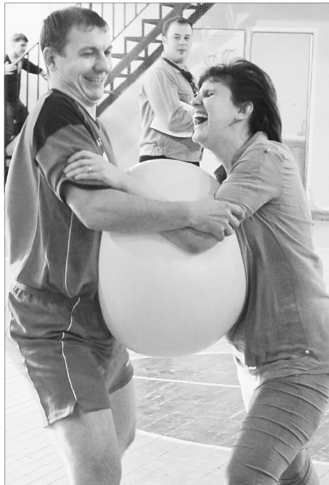
Пробежать с шаром оказывается непросто

Под звуки марша и гудок паровоза отправились в путешествие участники городского конкурса «Папа, мама, я – спортивная семья».