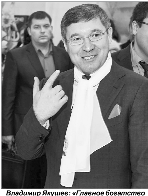
Владимир Якушев: «Главное богатство АПК - кадры»

15 ноября в Тюменском технопарке состоялось торжественное мероприятие, посвященное Дню работника сельского хозяйства и перерабатывающей промышленности, в котором приняли участие министр сельского хозяйства России Николай Фёдоров и губернатор Тюменской области Владимир Якушев.