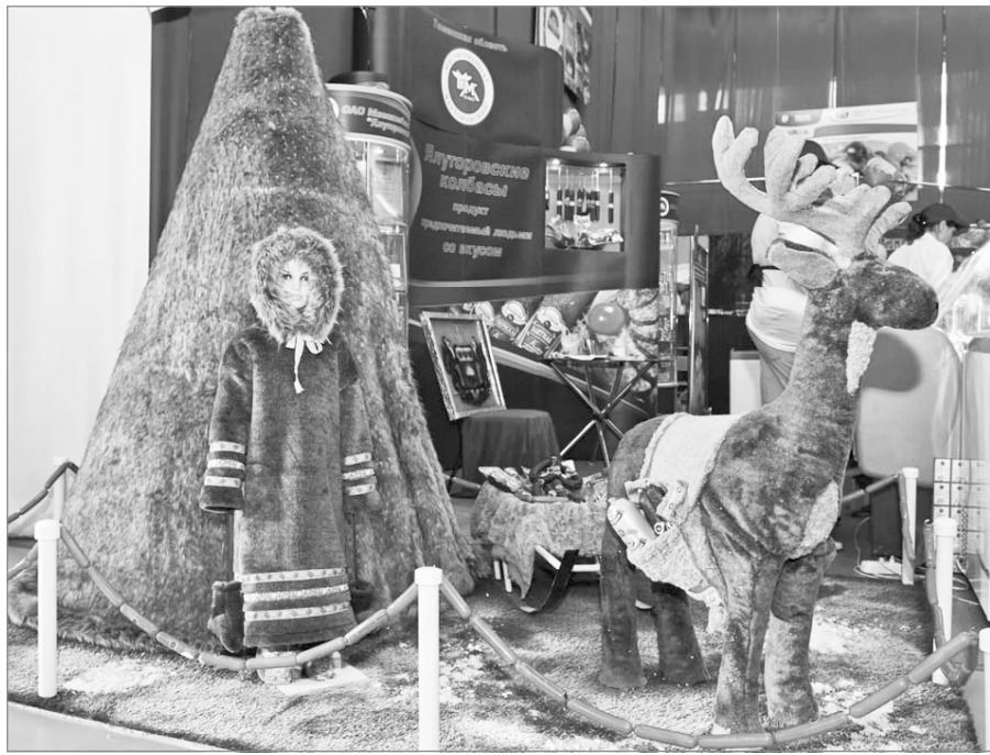
Презентация ОАО «Мясокомбинат Ялуторовский»