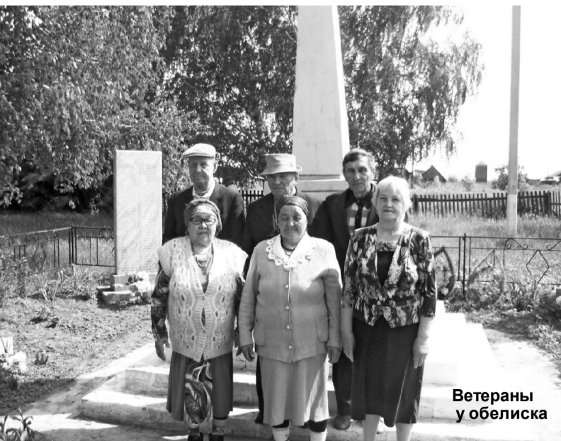
Ветераны у обелиска

К сожалению, надо сказать, что в костюмах, предметах для представлений, зрелищных постановок наш СДК испытывает