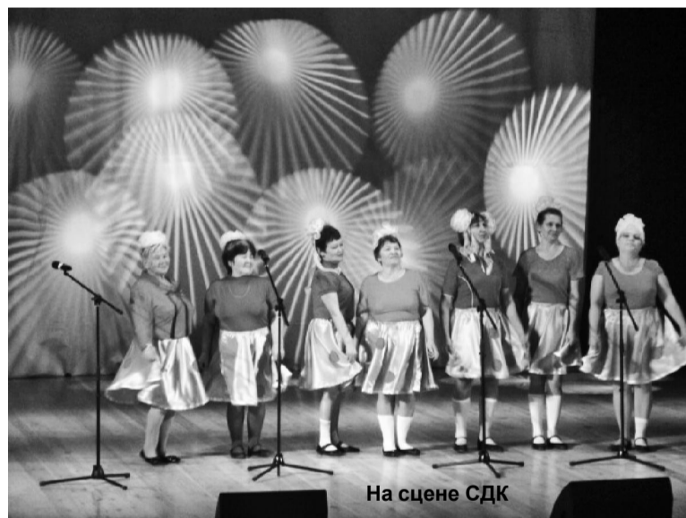
На сцене СДК