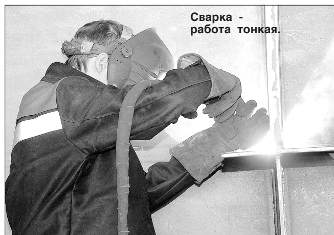
Сварка - работа тонкая.