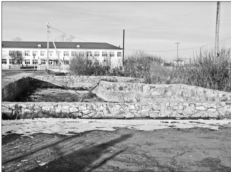
Останки фонтана – одна из большеярковских «достопримечательностей»

Ещё одна проблема, требующая разрешения, была поднята на сходе. Это благоустройство села. Один из жителей Больших Ярков с болью говорил о том, что в конкур-