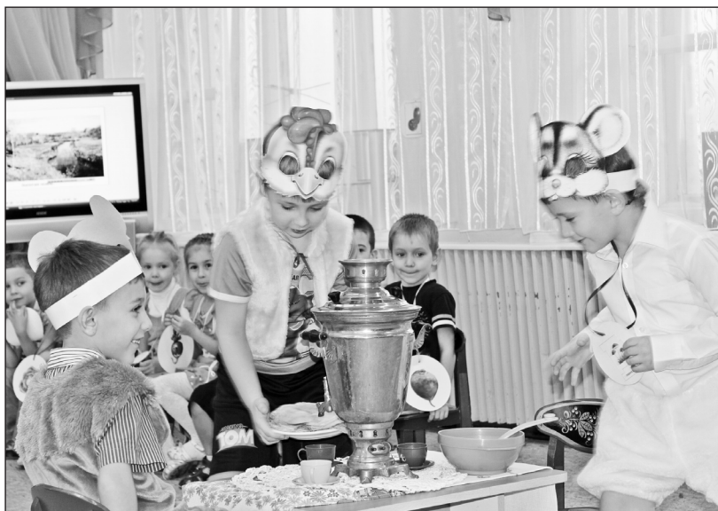
Юные артисты с увлечением исполняли свои роли