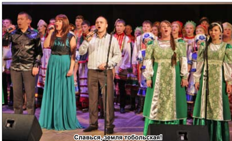
Славься, земля тобольская!