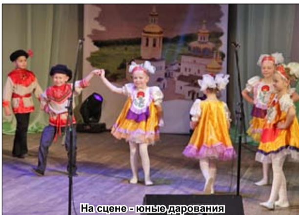
На сцене - юные дарования