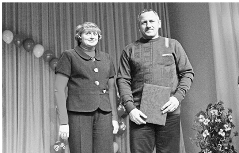
* Во время торжественной церемонии