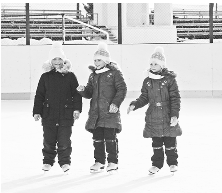
* На катке.