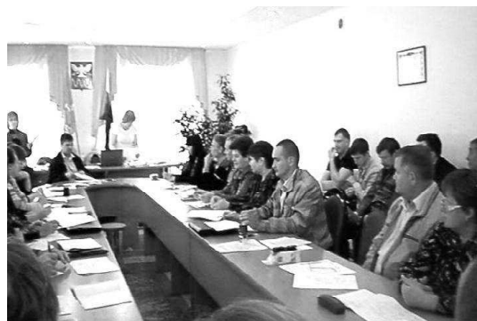
Подготовке специалистов, работодатели должны уделять особое внимание. В этом

году по инициативе центра занятости было проведено соответствующее обучение для руководителей и сотрудников организаций Викуловского района (на снимке). Проходило оно в течение 3 дней, и 43 специалиста приняли участие в этом обучении. По окончании все участники получили удостоверения установленного образца.