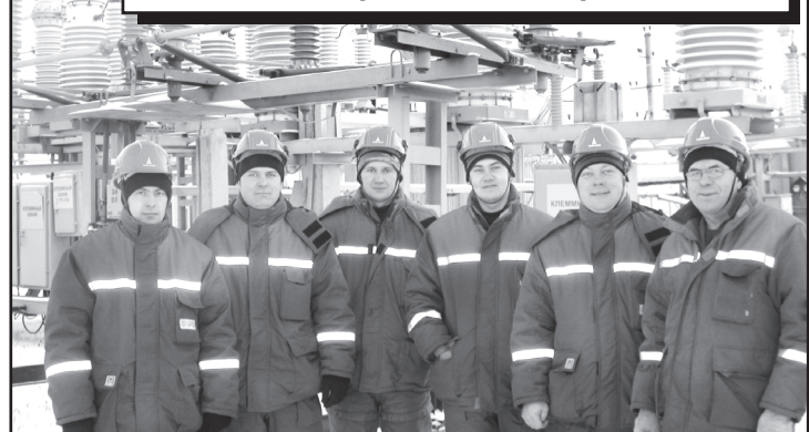
Бригада энергетиков Юргинского РЭС, обеспечивающая надёжную работу распределительных сетей