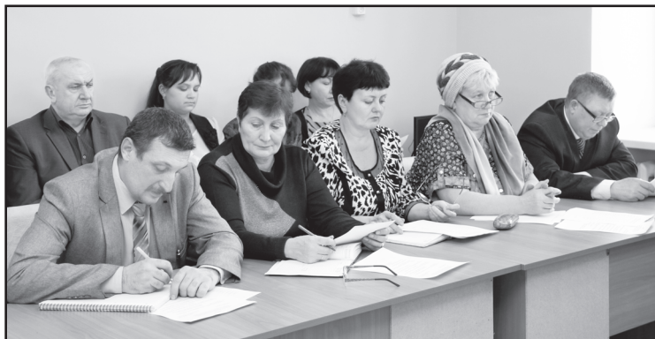
Заседание общественного совета по реализации приоритетного национального проекта «Здоровье»