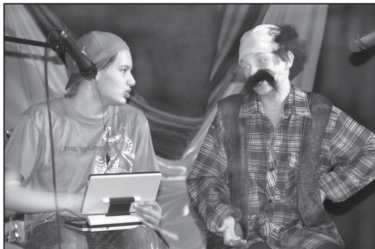
На районном многожанровом творческом фестивале-конкурсе