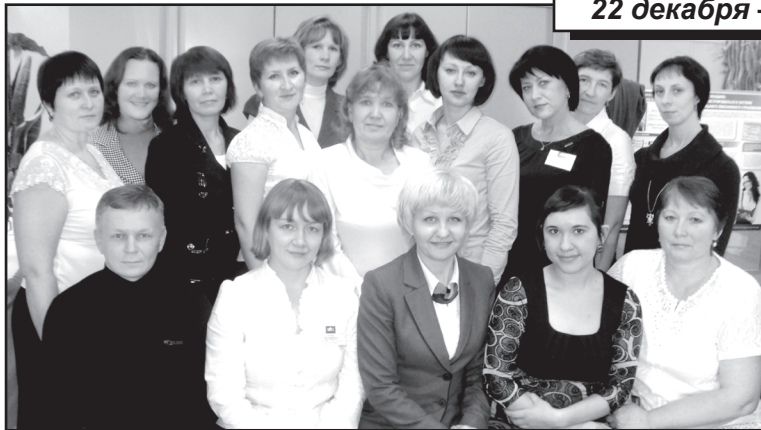
Коллектив Отдела ПФР в Юргинском районе

речиво говорят факты и цифры. Так, своевременно проиндексированы трудовые пенсии (почти на 10 процентов) и социальные (почти на 2 процента). Установлены новые размеры компенса-