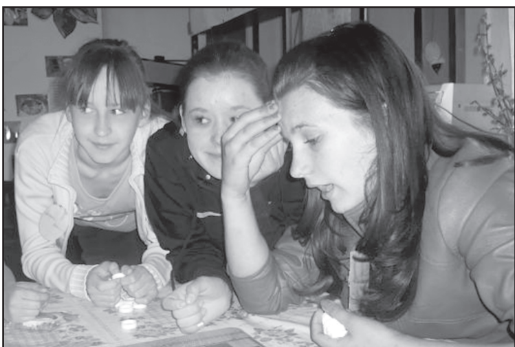
В ДК каждый найдёт занятие по душе

О. КОНОВАЛОВА