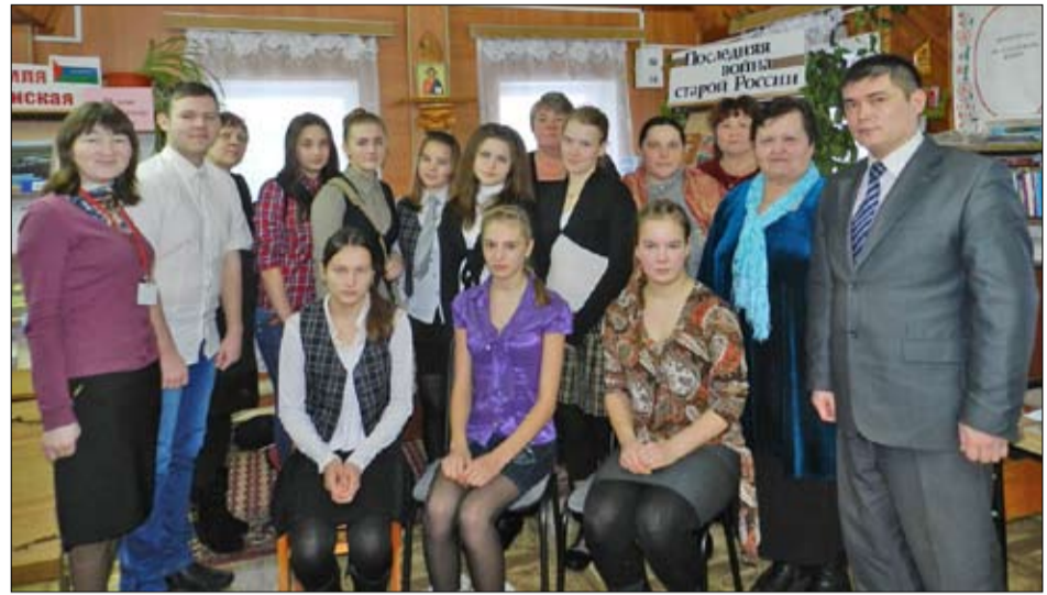
Игроки и болельщики

В следующем году исполнится 100 лет со дня её начала. Но работники районной библиотеки уже давно начали проводить различные мероприятия по информированию читателей. Это и фотовыставка «Первая мировая в лицах», и книжные выставки «История Первой мировой войны», «Россия и Первая мировая война». Уже два года тематическая рубрика включена в электронный каталог централизованной библиотечной системы. А недавно юные книголюбцы из Ушаровской, Овсянниковской и Сетовской би-