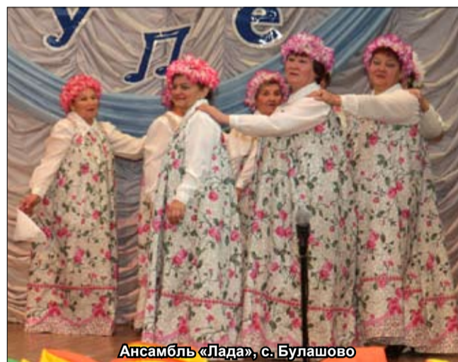
Ансамбль «Лада», с. Булашово