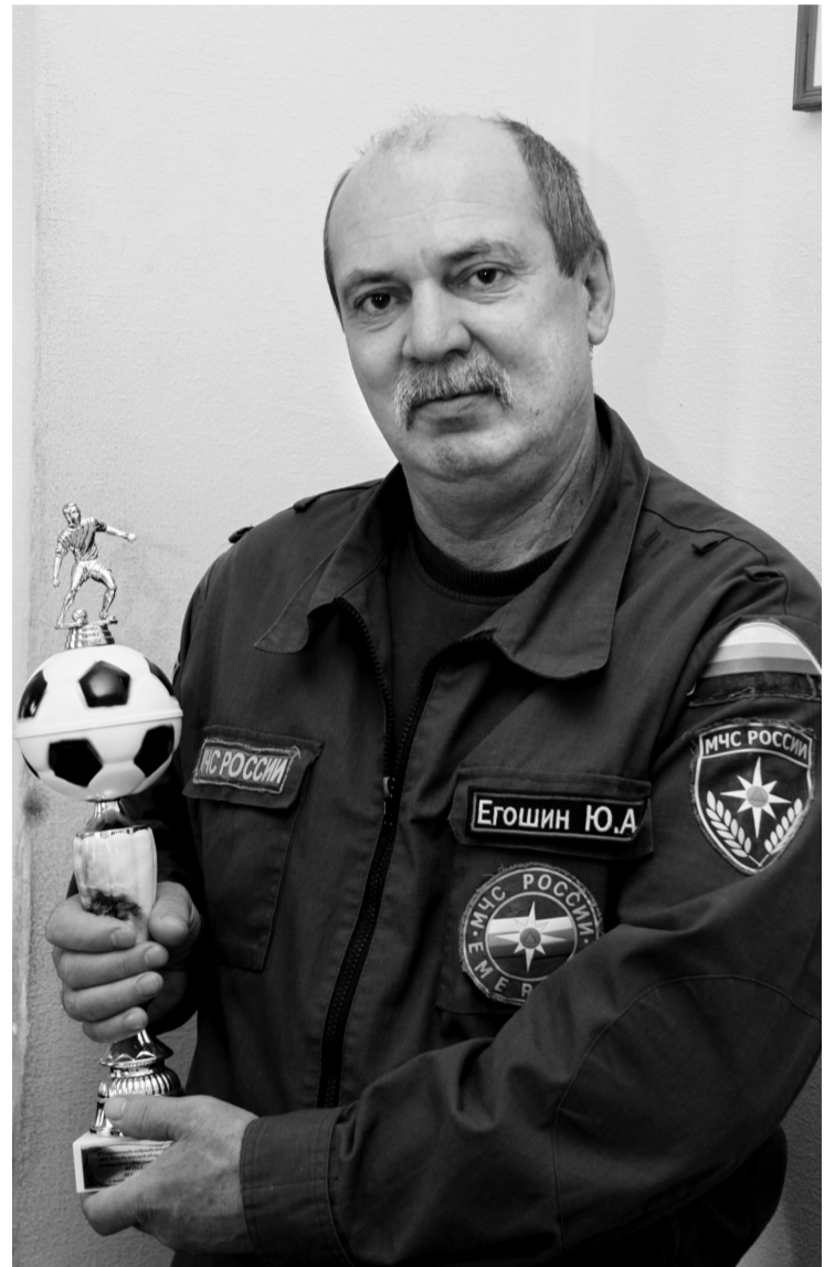
• Спорт спасателям не чужд.

– Иначе какой же я спасатель! – улыбается мой собеседник. – Команда: «Караул, на выезд!», и пожарная машина уже мчится туда, где случилась беда. Коллектив у нас ста-