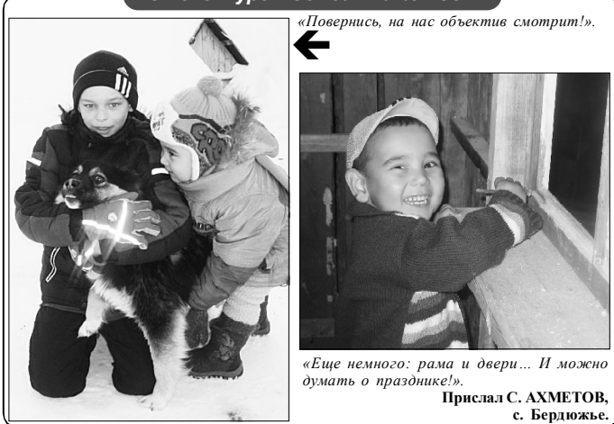
«Повернись, на нас объектив смотри!»