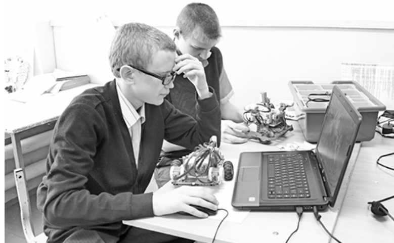
* Александровские интеллектуалы

– В сущности модели смогут сделать практически всё. Наши ученики добиваются хороших результатов, не останавливаются на достигнутом, стараются идти дальше. Для них робототехника стала не просто каким-то спортивным увлечением, игрой, а вполне серьёзным занятием. Это программа, освоение компьютера на высоком уровне. Развиваются логика, мышление, интеллектуальные способности, память, творчество.