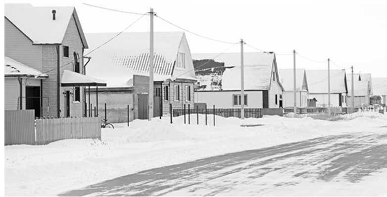
* Восточный микрорайон в с.Сладково

Анастасия ГАЦАЕВА