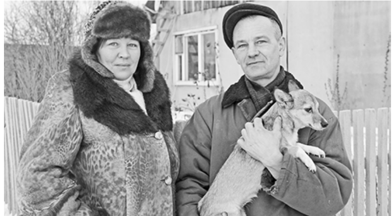
* Многодетные родители