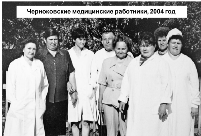
Черноковские медицинские работники, 2004 год