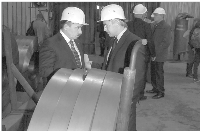
Окончание. Начало на стр. 1

В этом году немало сделано в благоустройстве. К примеру, появился сквозной проезд по улице Революции, который удобно связал два микрорайона. Приведены в нормальное состояние участки улиц Тюменской и 8 Марта около школы № 4. А в самом учебном заведении проведён капитальный ремонт на современном уровне. Завершен первый этап капремонта и в детском саду №5, построенном ещё в 1968 году. Решены все ключевые вопросы с центром развития ребёнка. В стадии экспертизы находится документация по реконструкции здания детско-юношеской спортивной школы и стадиона «Юность».