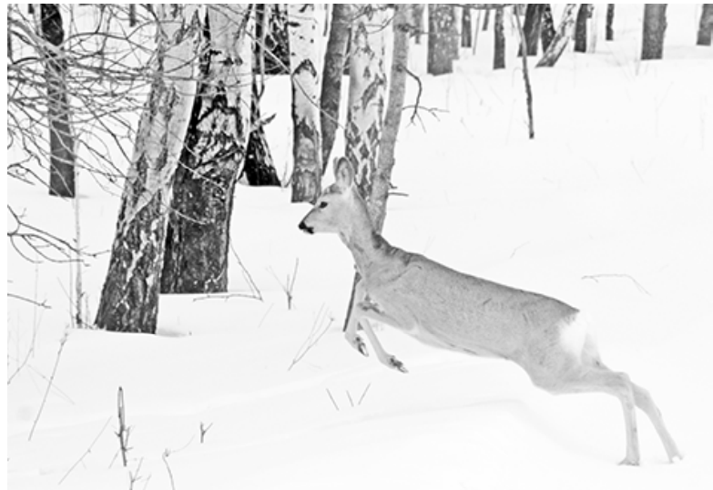
* На зимних лесных тропинках.