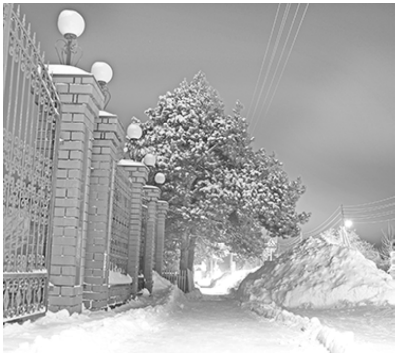
* Ночная улица Сладкова.