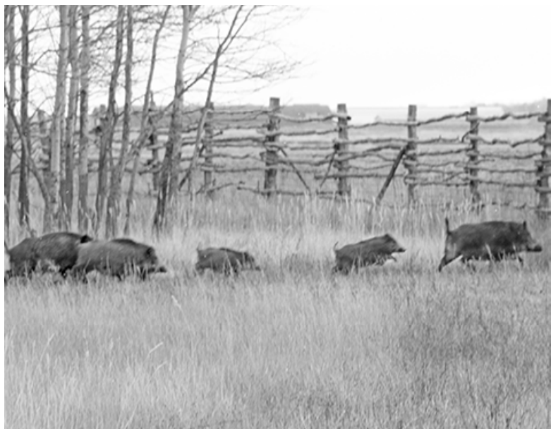
* Семейство диких кабанов.

ТАКСИ «ДИНАМИТ». Рейсы Сладково-Тюмень-Сладково. Отправление от гостиницы в 1 час. ночи и обратно из Тюмени ежедневно. Доставим и заберём пассажиров по адресу назначения. Предоставляем отчётные документы. Доставка вещей, документов. Стоимость проезда 600 руб. ИП «Губанов А.И.» Обр.: т. 8 9323202020.