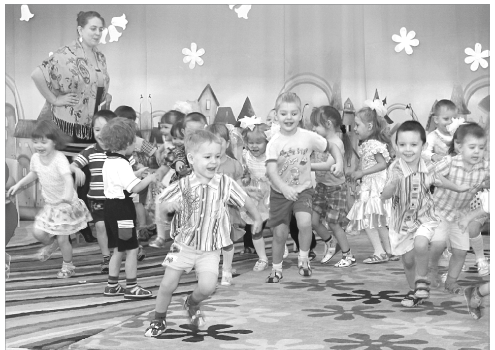
Малышам детсада № 8 не приходится скучать