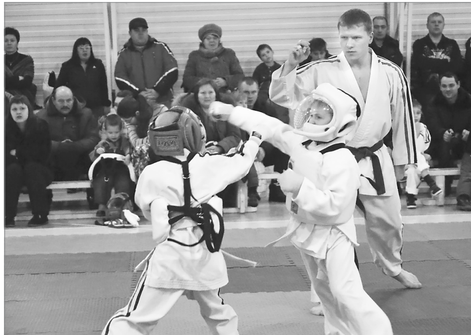
В боевом поединке

Рождественский турнир по косики каратэ среди воспитанников городских клубов «Фалькон» и «Успех» прошёл в школе имени Декабристов. В соревнованиях участвовали также тобольские ребята.