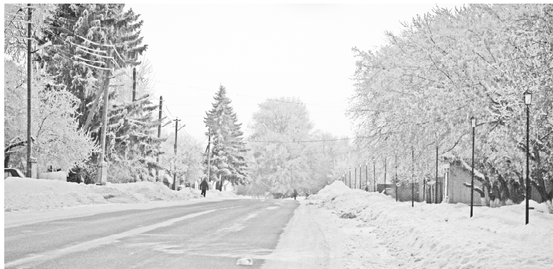
* Зимняя улица