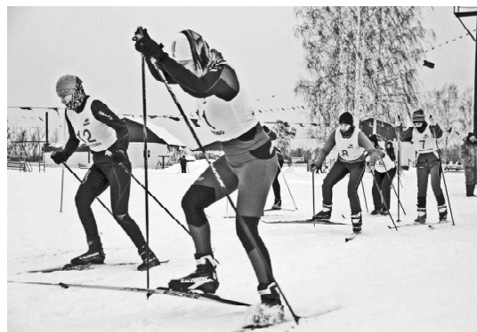
• Новое в законодательстве