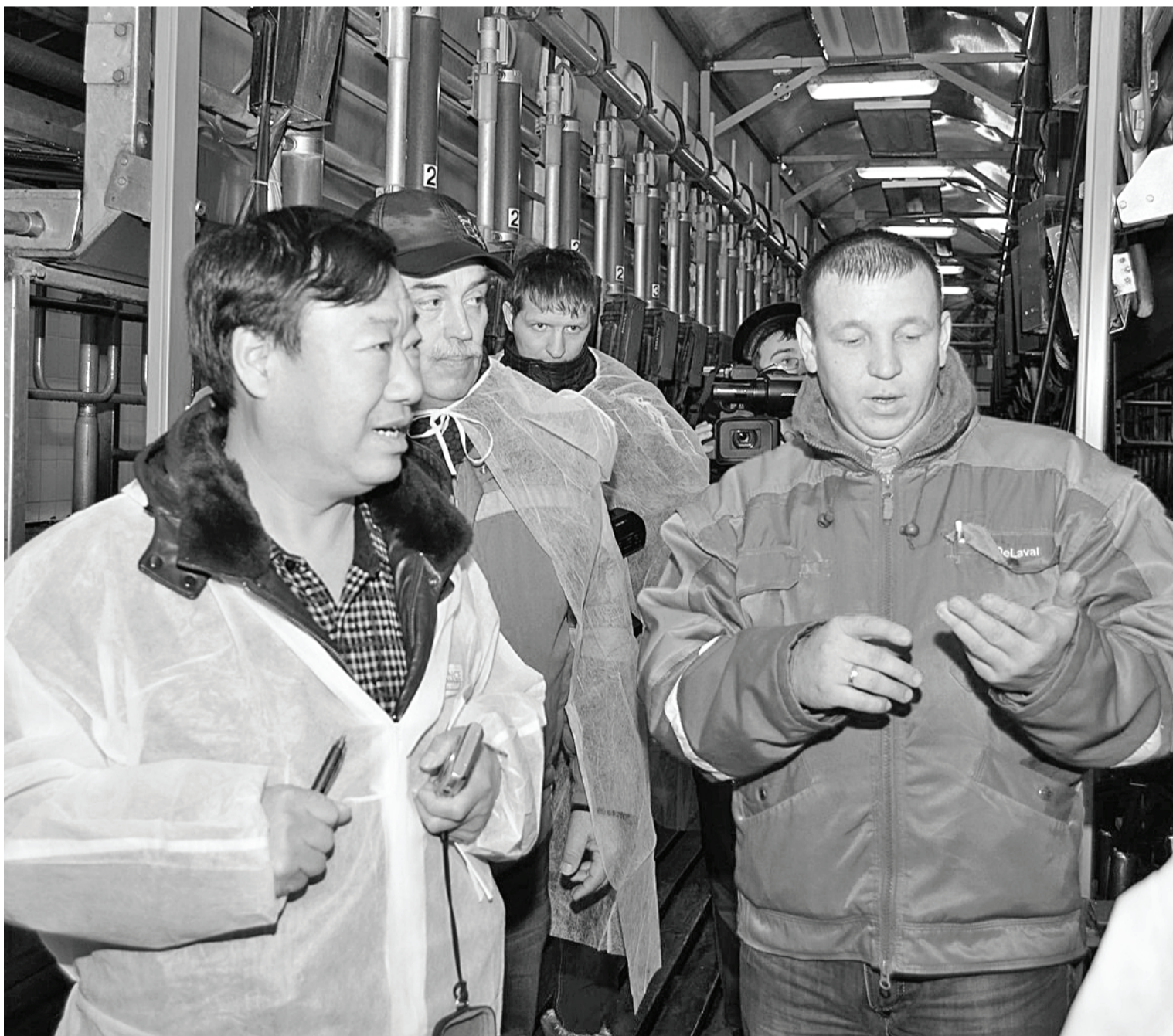
Знакомство с комплексом началось с доильного зала «Параллель».