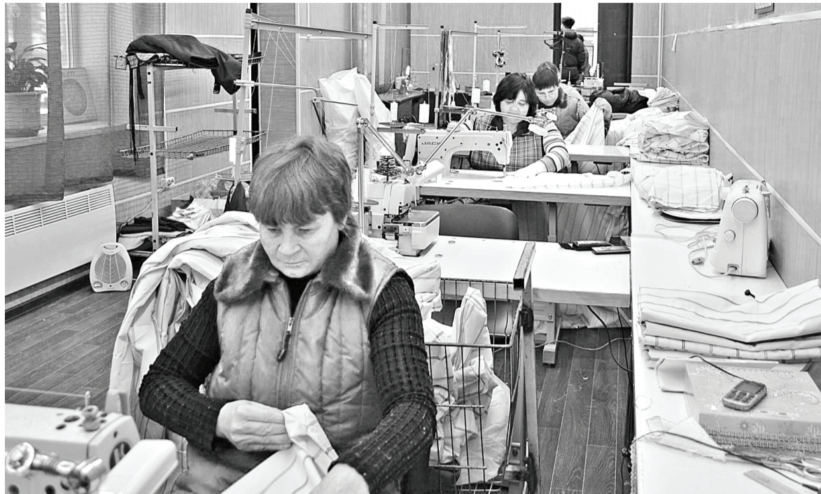
Работа в цехе идёт полным ходом. Не всё ещё получается так, как хотелось бы, но опыт дело наживное.

Как и в любом бизнес-начинании доля риска присутствует, поэтому уверенность, с которой директор подошла к созданию швейного производства в глубинке, подкупает. Конечно, для открытия цеха потребовались масса сил, времени, терпения и нервов, не говоря о материальных издержках; но сегодня все восемь швейных машин в цехе безостановочно стрекочут,