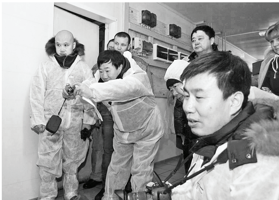
Это роботы-дойеры так изумили китайских коллег.