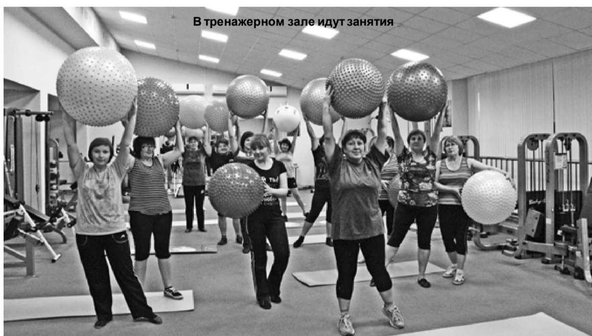
В тренажерном зале идут занятия

Активно посещают жители райцентра тренажерный зал спортивного комплекса. Многие предпочитают активный отдых в спортивном зале рутине монотонного домашнего быта. Женщины приходят в зал в надежде поправить пошатнувшееся здоровье, укрепить мышцы, повысить жизненный тонус, избавиться от болей в спине, суставах, шее. Регулярно занимаясь спортом, выполняя оздоровительные упражнения, снижают вес, становятся стройнее, избавляются от различного вида болей. Заряжаются энергией и хорошим настроением от общения друг с другом. Многие посещают тренажерный зал уже несколько лет, занимаются круглый год.