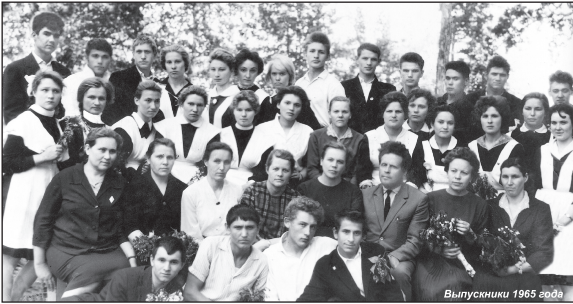
Выпускники 1965 года