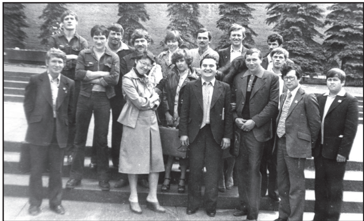
Делегация Тюменской области

Т. УСОЛЬЦЕВА