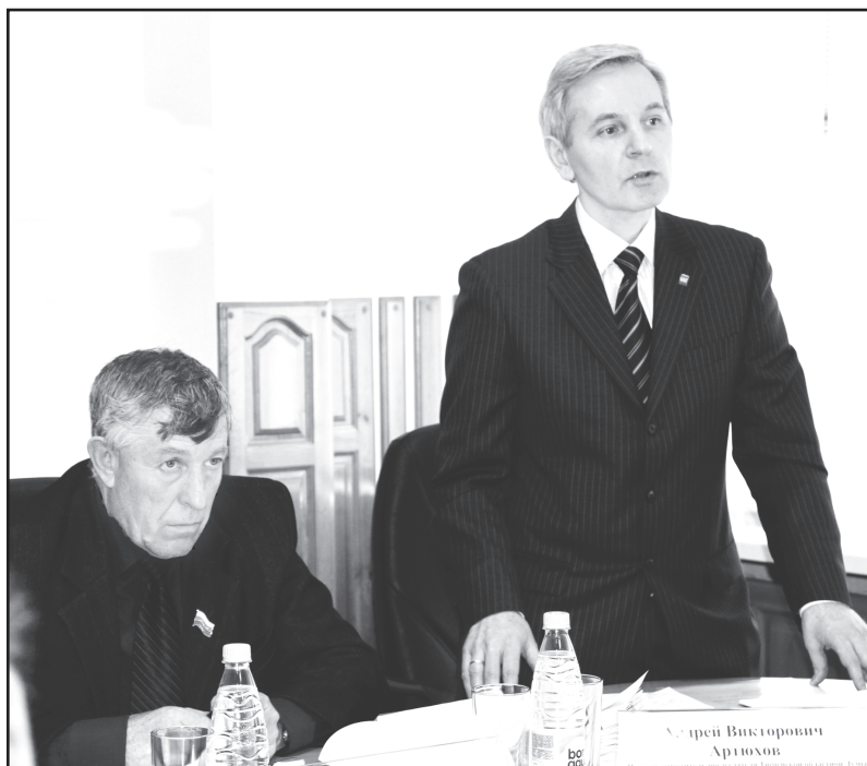
Открытие заседания думы района