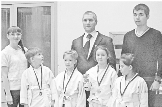
* Участники соревнований упорства, трудолюбия и терпения. И тогда победы обязательно придут.

Андрей ЗДОРОВЫХ, тренер-преподаватель по дзюдо