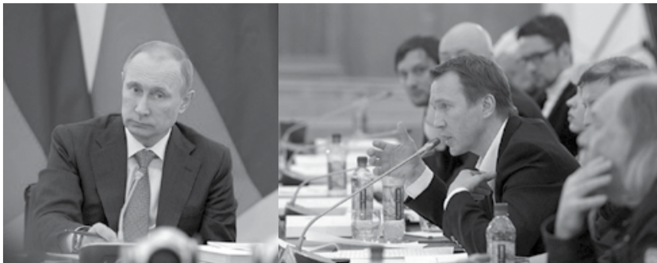
Евгений Миронов отвечает на вопрос Президента РФ о будущем ТДТ