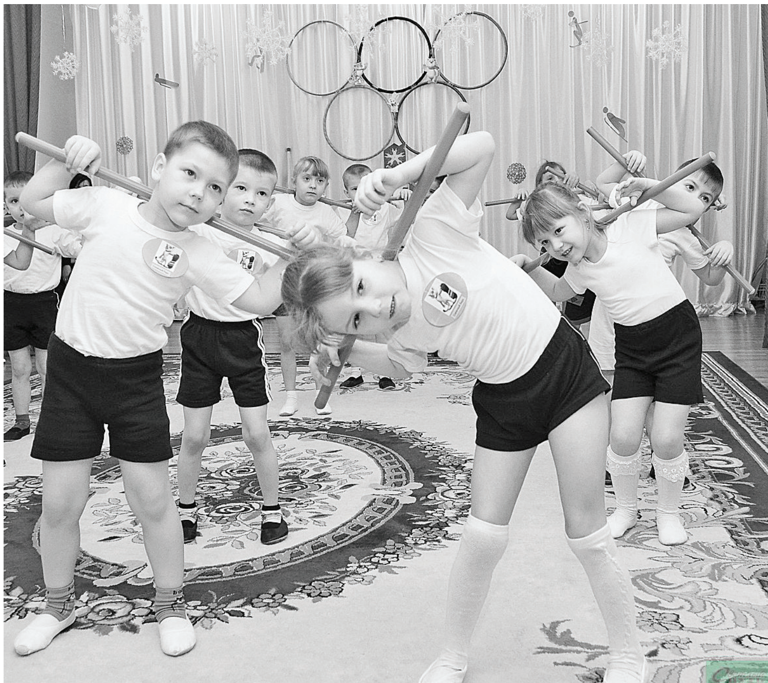
Сильные, смелые, ловкие, умелые – настоящие маленькие олимпийцы!

К Олимпийским играм 2014 года готовятся не только профессиональные спортсмены, любители побороть за своих, студенты и школьники, но и воспитанники дошкольных учреждений – наши маленькие сельские звездочки. Правда, Олимпиада у них своя, особенная. 5 февраля мы на ней побывали. А пригласил нас к себе в гости Нижнетавдинский детский сад «Ручеек», здесь физической культуре и здоровому образу жизни малышей уделяется большое внимание.