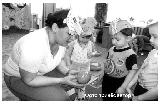
Фото принёс автор

Всем воспитателям известна процедура, позволяющая узаконить уровень знаний. Другими словами – каждый воспитатель проходит аттестацию раз в 5 лет. В разных регионах страны аттестация работников ДОУ проходит по-разному: кто-то защищает уровень своих знаний через проекты, кто-то – через участие в международных, российских и региональных конкурсах, кто-то аттестацию проходит через защиту папок портфолио или показ организованных мероприятий с детьми, а также взрослыми.