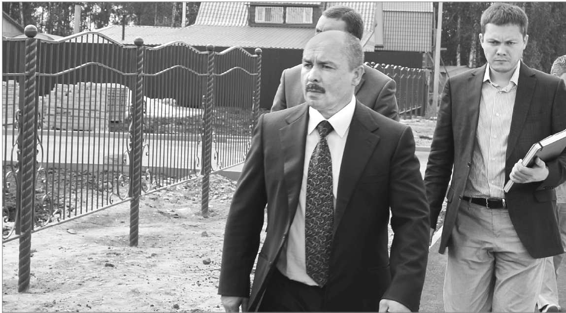
Осмотр хода реконструкции школы №4