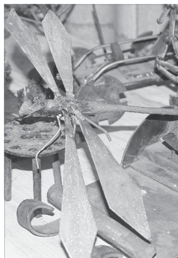
Из металла - лёгкие крылья

Вот и сейчас в филиале ТюмГНГУ в рамках Всероссийского проекта «Славим человека тру-