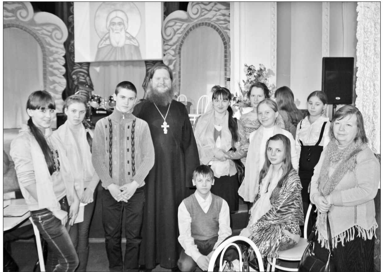
Уж кому-кому, а этим ребятам известно, кто в нашей истории русской истинные герои

Игру организовали в великолепном, красно украшенном и, главное, тёплом зале городского ДК. По преимуществу бородастым мужским и ненакрашенным женским лицам зрителей (наверняка мамы-папы-бабушки участников) можно было догадаться, что народ собрался в зале духовный и православный. Но чем ближе было к началу, тем понятнее становилось, что в игре примут участие и представители светских учебных заведений: вон подтянулись крепкие парни из политеха, а из-за соседних столиков кокетливо поглядывают девчата из ИГПИ и ТГУ. В общем, на интеллектуальное многоборье явилось 10 юных команд, от пенцов воскресных школ при храмах до бойких воспитанников военно-патриотических городских объединений и даже студентов. Интересно, что из сельских районов своих интеллектуалов делегировали только мы и бердюжцы.