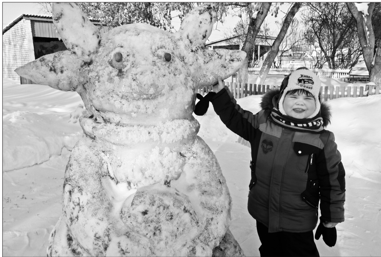
Ребята с удовольствием общаются со своими любимыми мультяшными героями

Примерно десять КамАЗов со снегом, и это по самым скромным нашим подсчётам, понадобилось бы для создания зимнего волшебства – различных мультяшных героев, которые вот уже третий год подряд «приходят» в гости на детские площадки казанского детсада «Ёлочка».