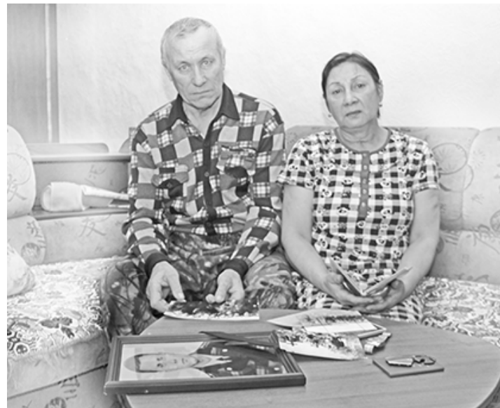
* Родители героя