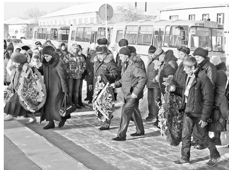
* Возложение венков

В фойе районного Дома культуры краеведческий музей развернул выставку, посвящённую нашим землякам-афганцам». На ней представлены фотографии, книги, альбомы, форма воина-интернационалиста с наградами. С 17 февраля экспозиция демонстрируется и в музее.