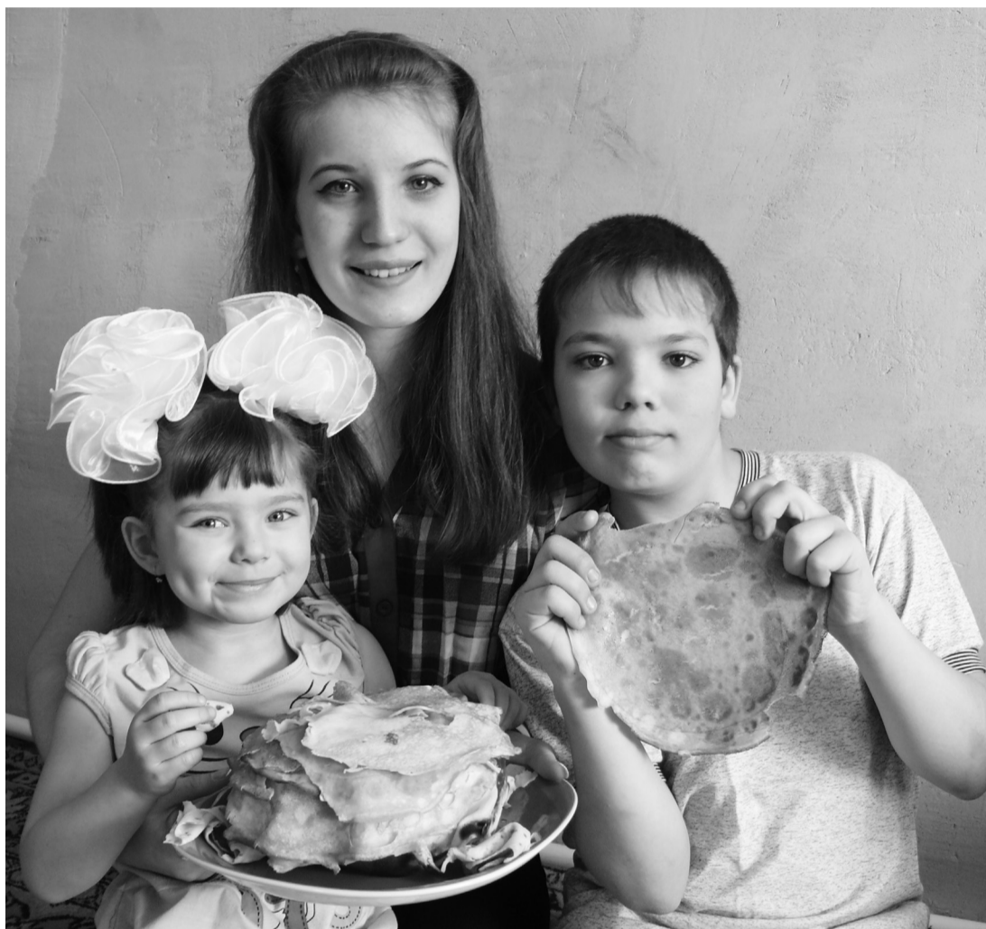
• Мы давно блинов не ели...

В понедельник россияне и заводоуковцы в том числе встретили Масленицу. Праздник проводов зимы длится семь дней и называется ещё Сырной седмицей.