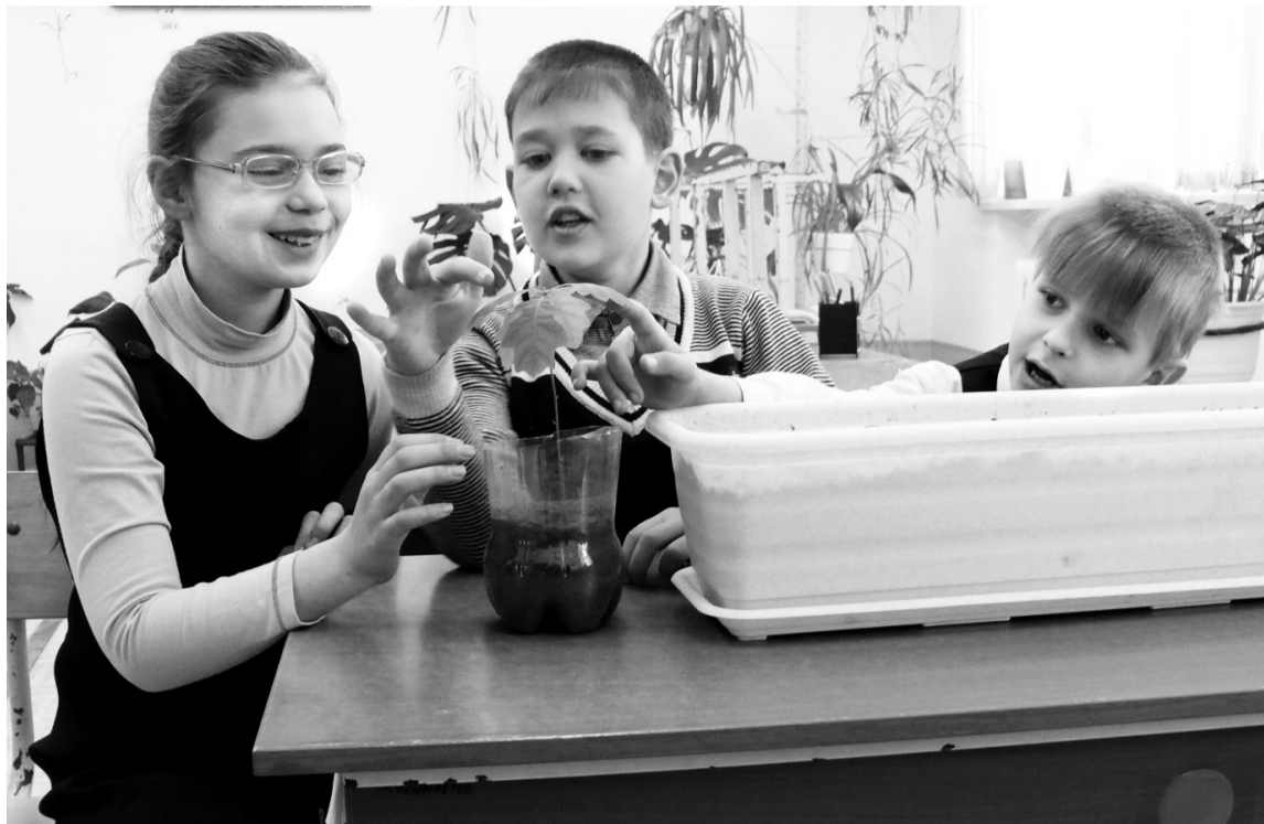
• Пока дубок невысок.

Сеять разумное, доброе, вечное продолжают в Лебедёвской средней школе, в том числе и в школьном лесничестве «Голубая планета».