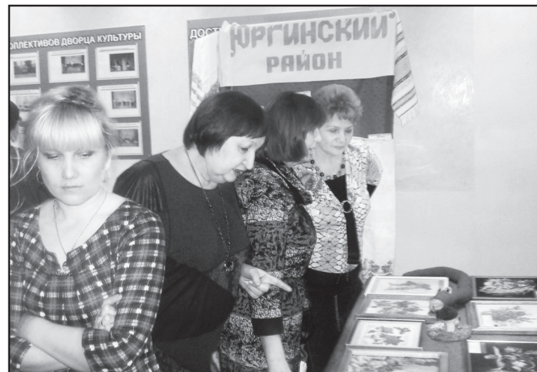
Выставка декоративно-прикладного искусства