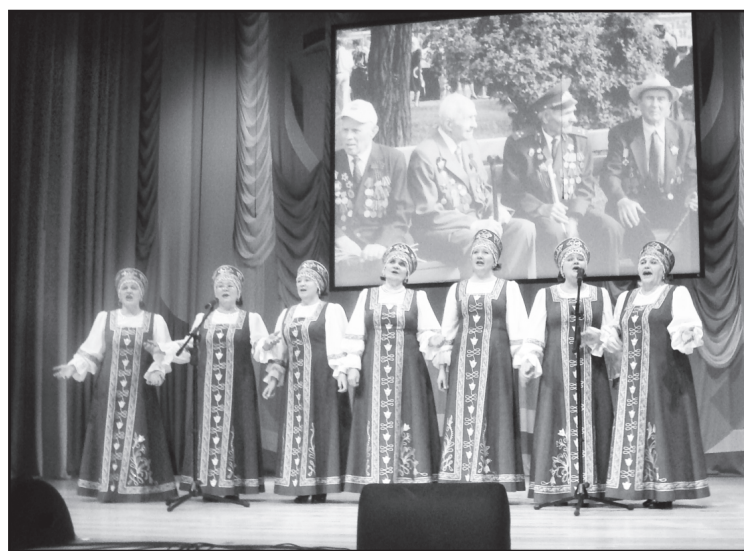
На сцене – агаракцы

достойно. Жюри, подводя предварительные итоги, отметило интересный, раскрывающий тему видеоматериал, представленный юргинцами.