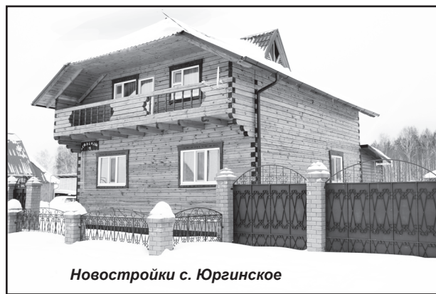
Новостройки с. Юргинское