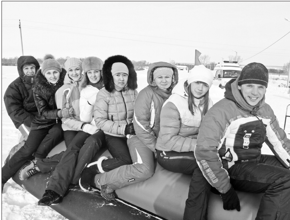
Боровлянская база – не только излюбленное место отдыха, но и место спортивных состязаний

С 1994 года в центре работает объединение «Спортивный туризм», воспитанники которого выступают на соревнованиях в зачёте областной спартакиады школьников, являются победителями и призёрами областных первенств и чемпионатов по спортивному туризму, фестивалю туристов и путешественников Тюменской области. В районе имеется пять команд, активно занимающихся спортивным туриз-