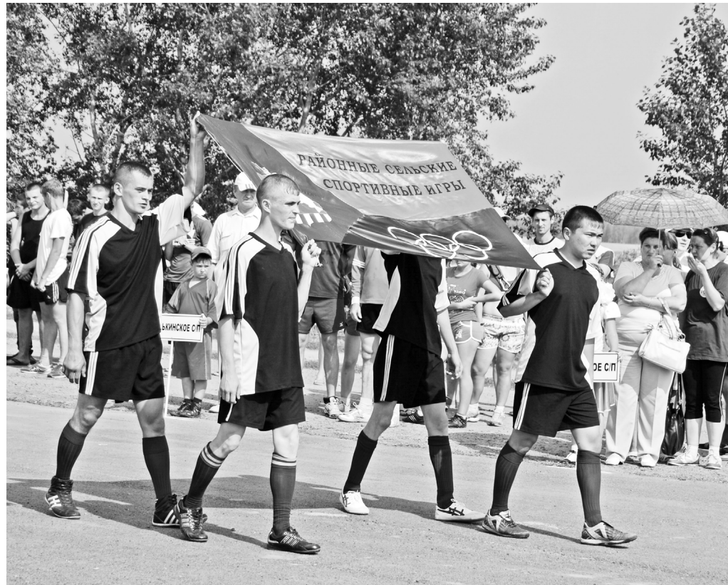
Сельские спортивные игры – одно из традиционных мероприятий, проводимых в районе для популяризации здорового образа жизни

Закончилась Олимпиада, утихли страсти болельщиков, спортсмены вернулись с медалями. Но говорить о таком грандиозном событии будут ещё долго, как и обсуждать состояние дел в отечественном спорте сегодня. Что ж, это хороший повод затронуть эту тему и нам. Чем и как живёт наш, местный, казанский спорт? Вырастим ли мы к следующим Олимпиадам своих чемпионов? Об этом и не только об этом говорилось на рабочем совещании отдела по спорту и молодёжной политике администрации Казанского района.