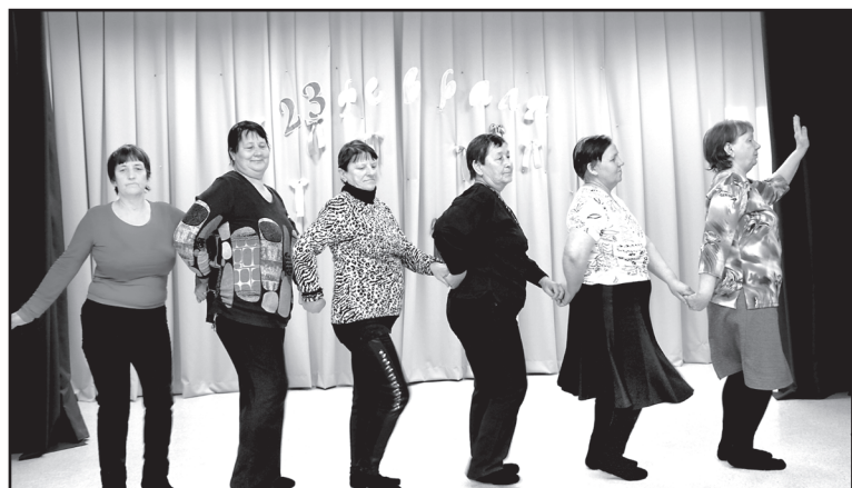
На репетиции клубного формирования «Кумушки»