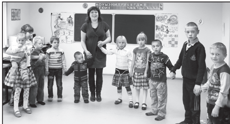
Мероприятие для малышей

О. АЛЕКСАНДРОВА