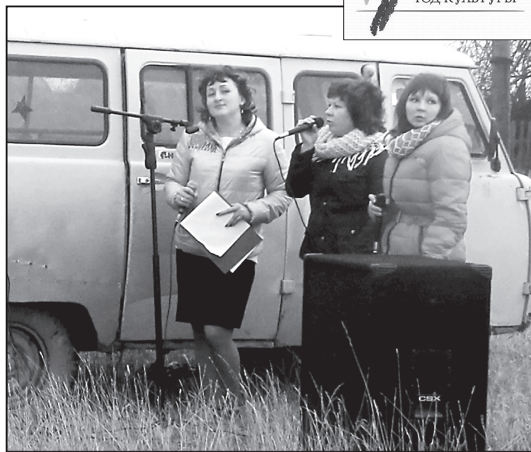
С концертом — к жителям малой деревни