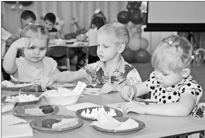
Так увлечь малышей – задача непростая