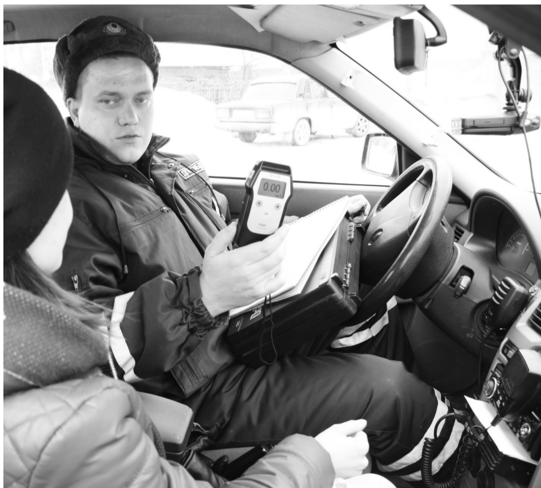
• Нетрезвых женщин за рулём инспекторы пока не останавливали.

По данным Заводоуковского отдела ГИБДД, уже с начала года в городе и округе задержано 93 водителя, управлявших автотранспортом в нетрезвом состоянии.