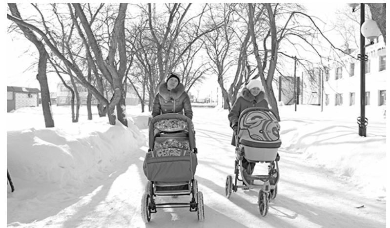
* Первые дни весны